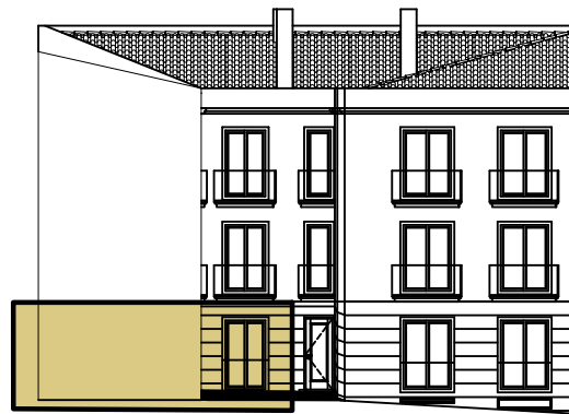
S/ Escala - Alçado Principal